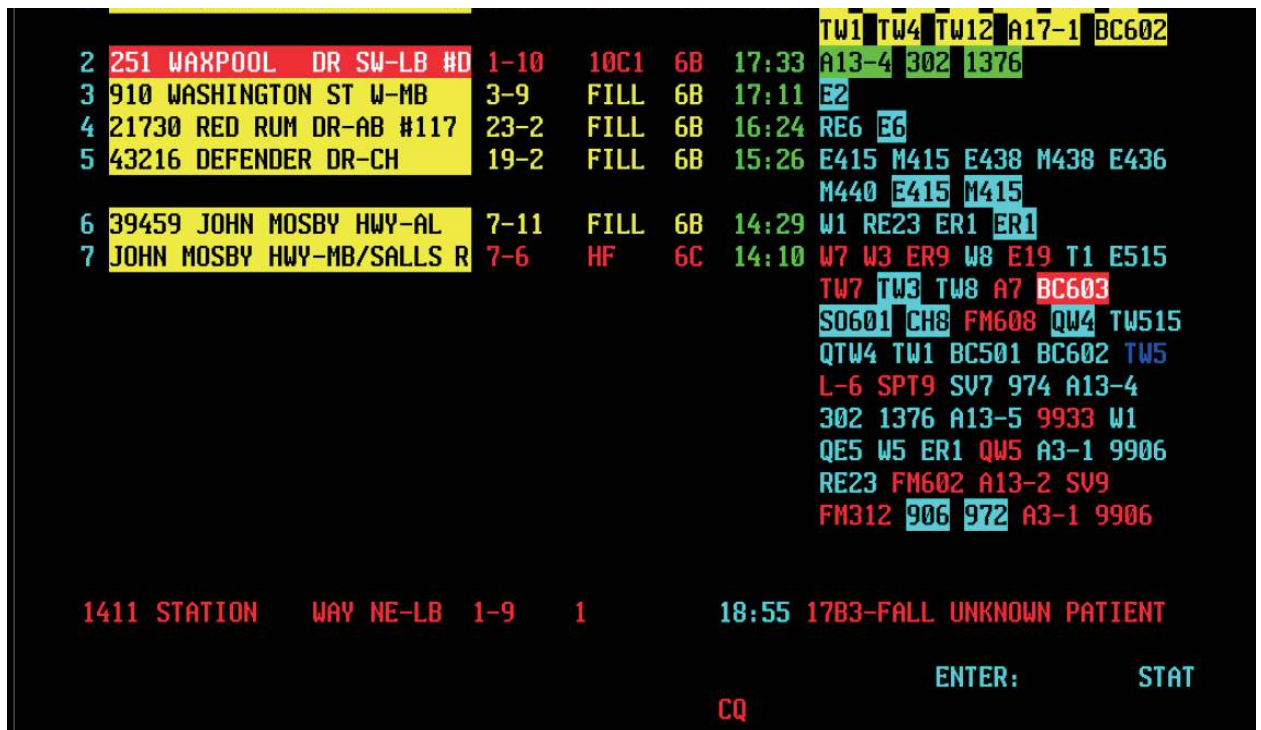
Figura 1: Una pantalla de un sistema CAD que un operador de la sala de control está utilizando para enviar varios vehículos de bomberos