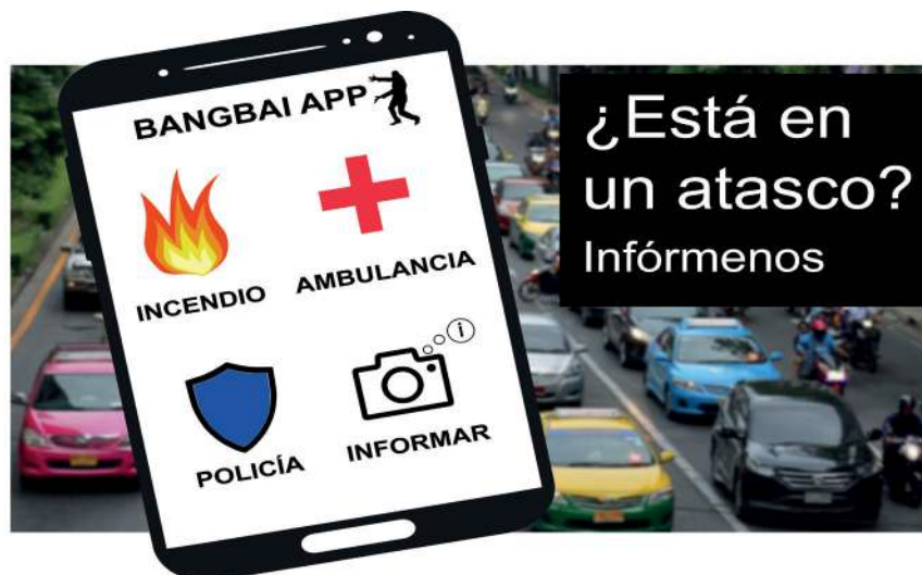
Figura 4: Ejemplo de un póster para promover el uso de la función “Informar” de la aplicación de Bangbai